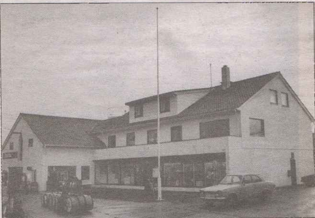
I 30 år har Nikøy A/S halde til i dei noverande lokala ved kaia. Frå 1903 har Nikøy-familien drive handel i Bulandet.